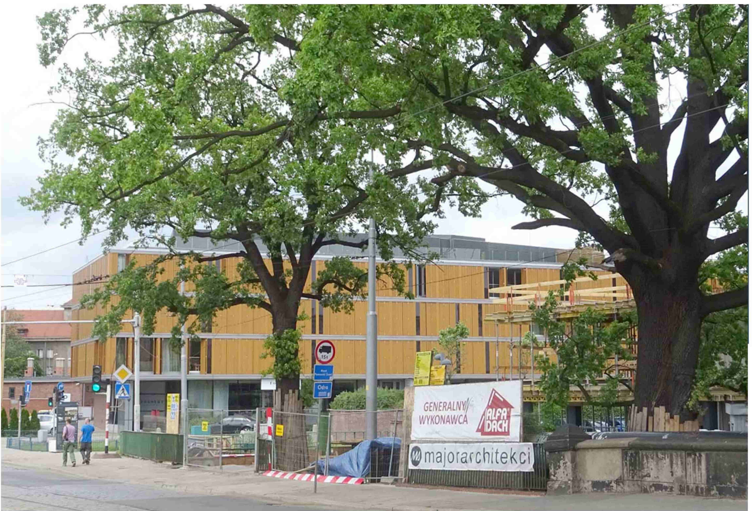
OPINIA DLA DWÓCH DĘBÓW NA WYSPIE STRONA 2/3