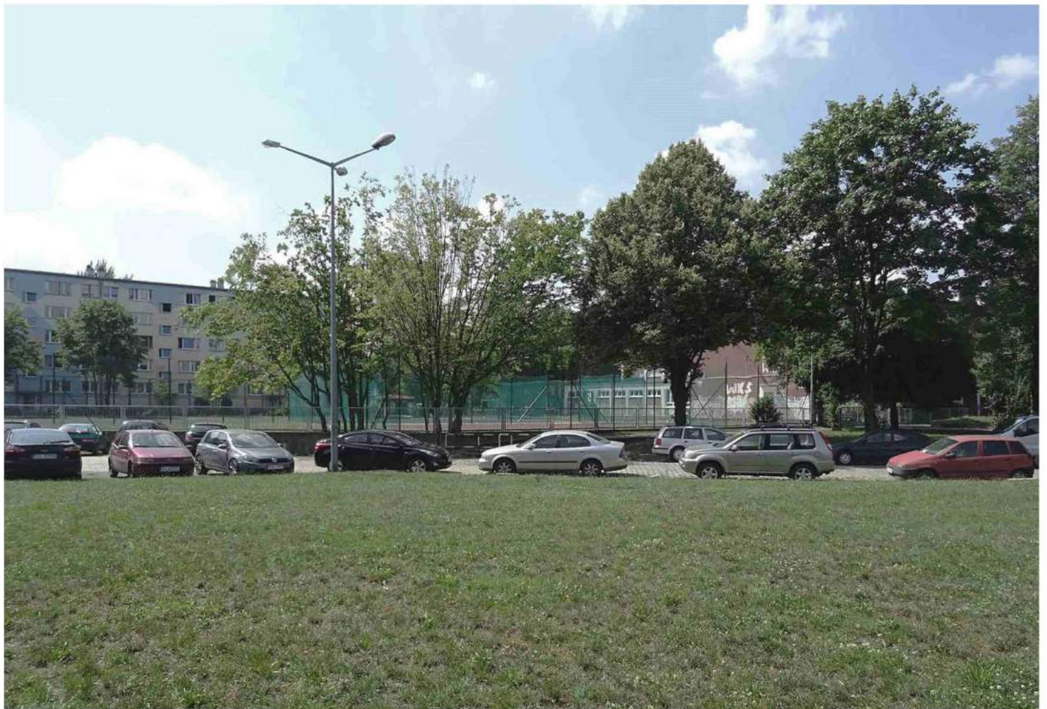
PARK KIESZONKOWY „PSIA GÓRKA” STRONA 2/6