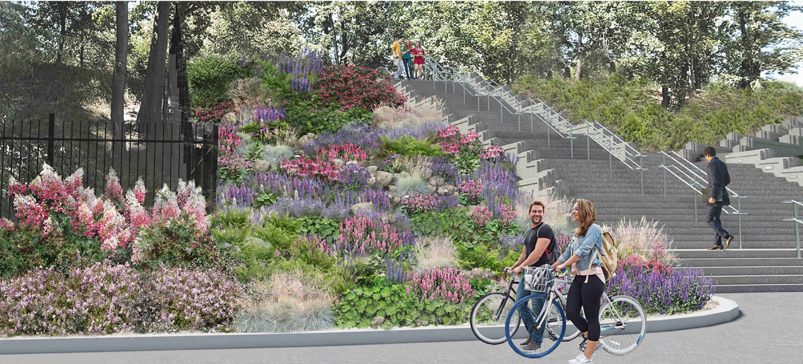
PROJEKT ZAMIENNY SKARPY W PARKU CENTRALNYM STRONA 2/4