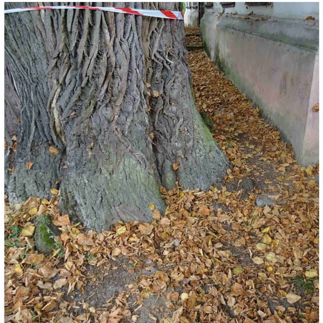
EKSPERTYZA LIP W STAROŚCINIE - BADANIE TOMOGRAFEM STRONA 3/4