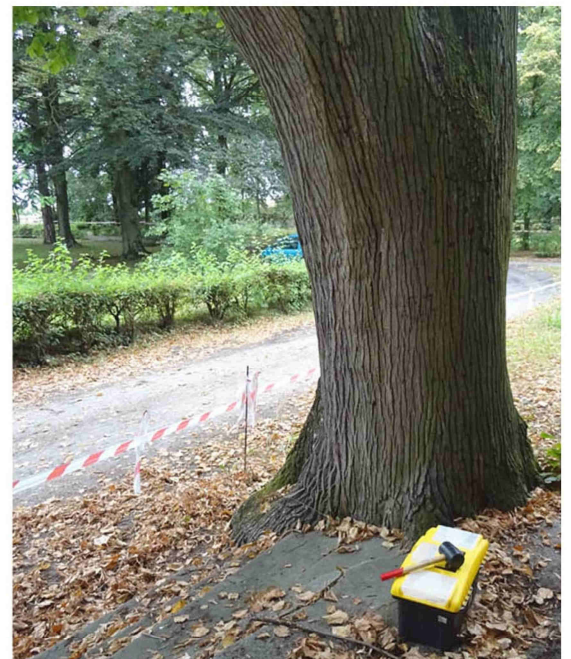
EKSPERTYZA LIP W STAROŚCINIE - BADANIE TOMOGRAFEM STRONA 2/4